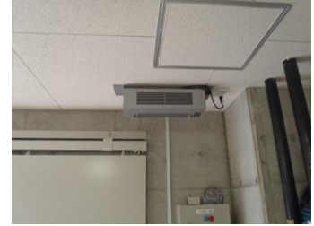
給気がドアの開閉のみの場合の取付例