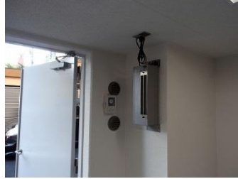
給気が壁面の場合の取付例