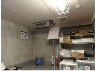
天井に給気口がある場合の取付例